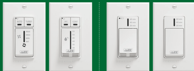
Commande automatique 41304